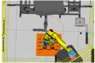
04. Desarrollo de Software