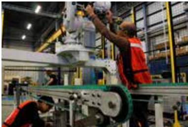
02. Proyectos llave en mano